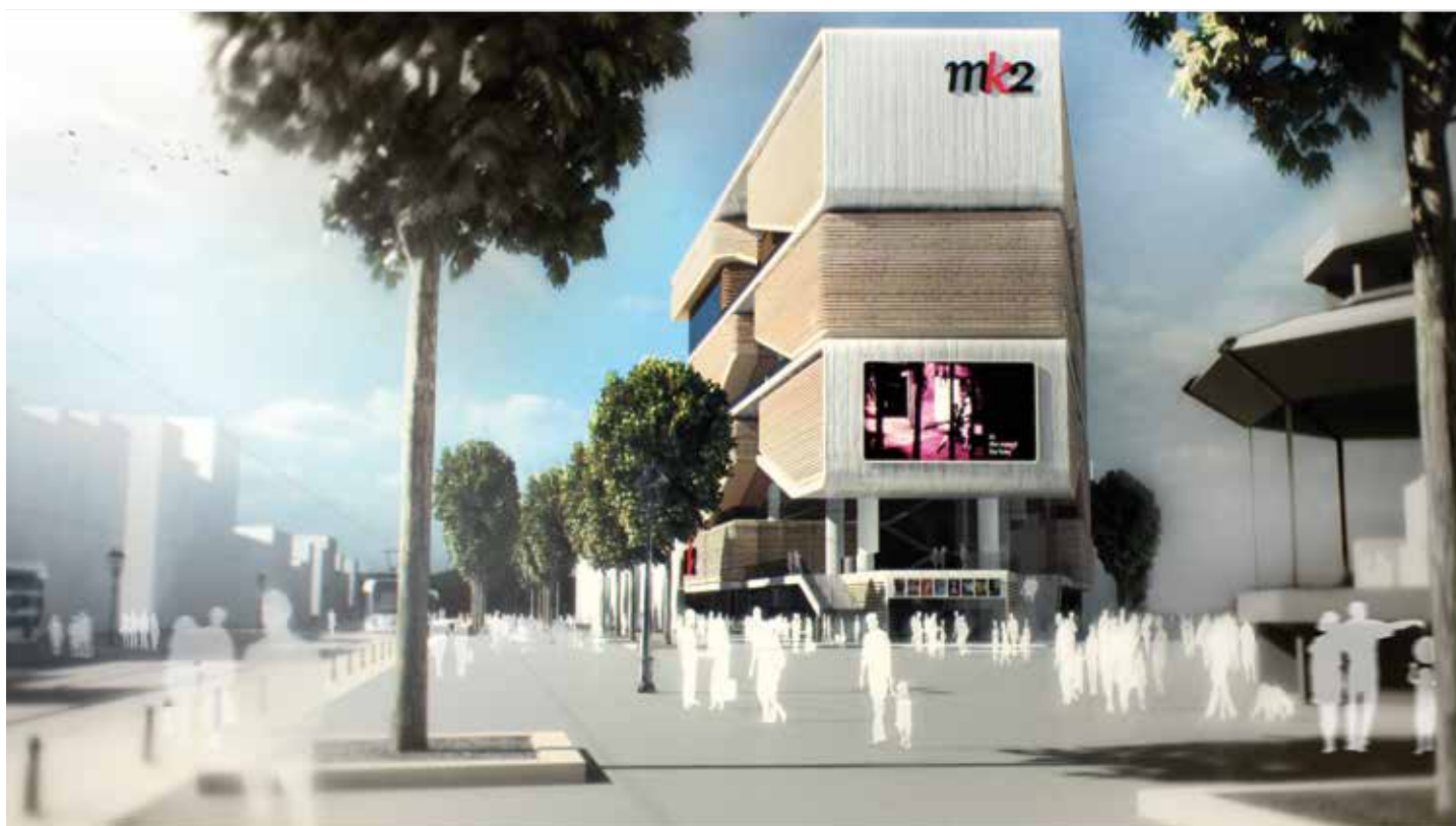
LA FACADE EST vue depuis la place Léon Blum