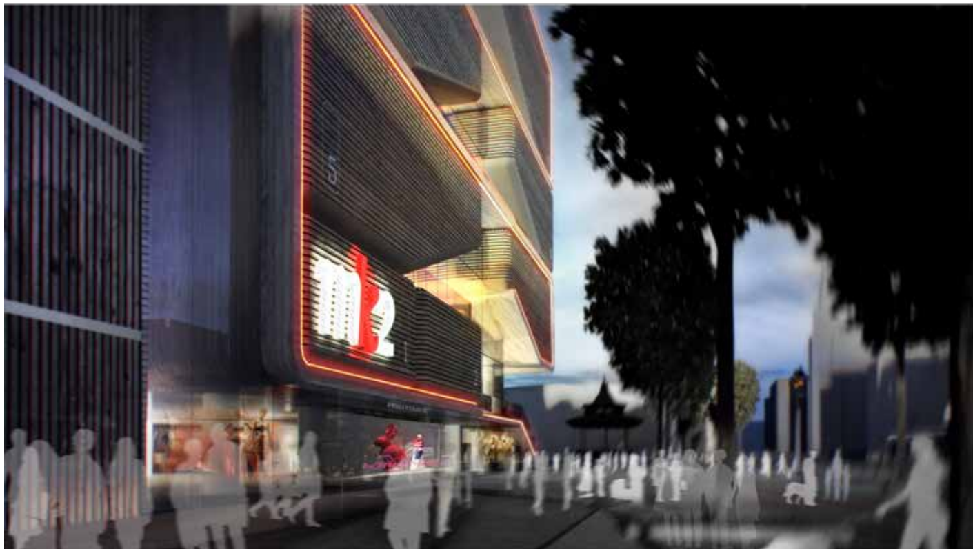
LA FACADE SUD vue depuis la place L. Blum