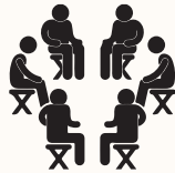
RÉUNIR DEUX GROUPES D'ÉTRANGERS