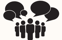
UN DIALOGUE OUVERT EST FACILITÉ SUR LE JUGEMENT ET L'INCLUSION SOCIALE