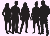
AMBASSADEUR.ICE.S DE LA JEUNESSE

L'apathie c'est plate est une organisation dirigée par des jeunes qui s'efforce de sensibiliser et de soutenir nos pairs à travers le Canada afin qu'ils deviennent des citoyens actifs et contributifs. L'un des moyens d'y parvenir est notre programme AGIR.