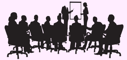
CRÉER UN PROJET COMMUNAUTAIRE FAVORISANT L'INCLUSION SOCIALE