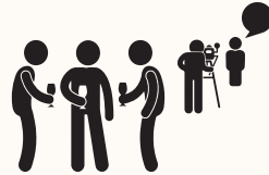
LES AMENER À SE POSER DES QUESTIONS PENDANT LE TOURNAGE