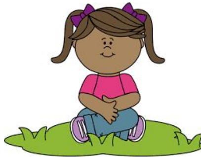
Nou pa renmen (chita) lakay.