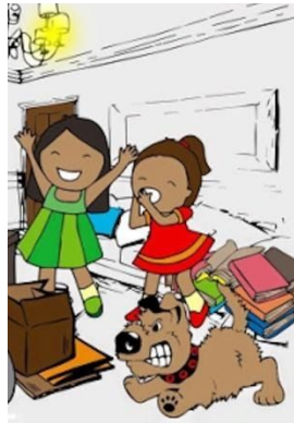
Jodi a nou rete (lakay).