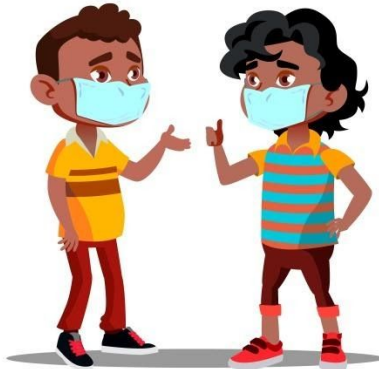
Nou pa _____ (soti)