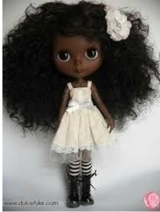
Epi yon ti (pope).