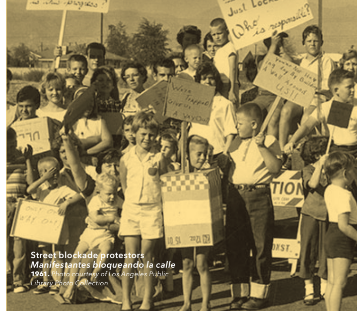
Street blockade protestors Manifestantes bloqueando la calle 1961.

Cuando se construyó el Freeway 5, algunas partes de Pacoima quedaron separadas del resto. Lo que había sido el este de Pacoima acabó siendo la nueva comunidad de Arleta en 1968.