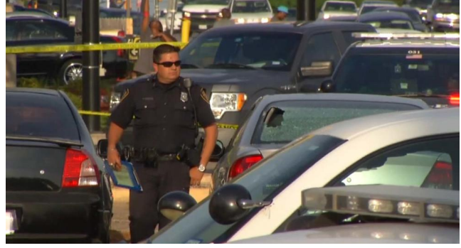
Durante meses el grupo Interfaith ha tenido pláticas con varios jefes de policía del Metroplex para que se acepte esta credencial expedida por miembros de esa agrupación.