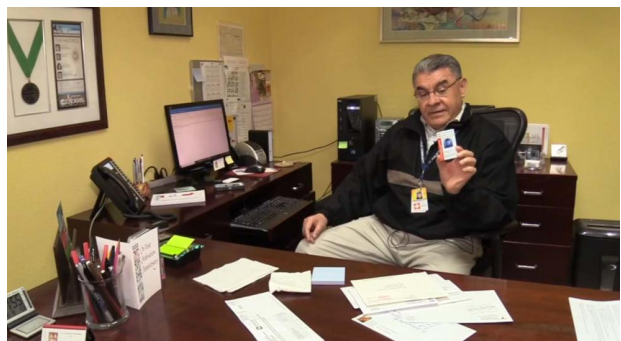
Las iglesias que son miembro del grupo Interfaith comenzarán a expedir estas credenciales en los próximos días.