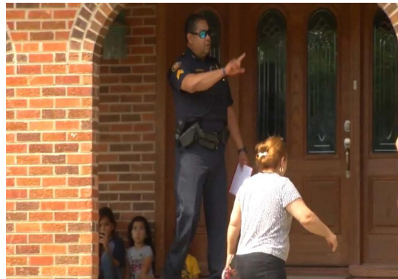
Miembros del grupo Interfaith advierten que esto es solo una identificación y que será a discreción de los oficiales aceptarla o no y por eso se recomienda darle el uso adecuado.