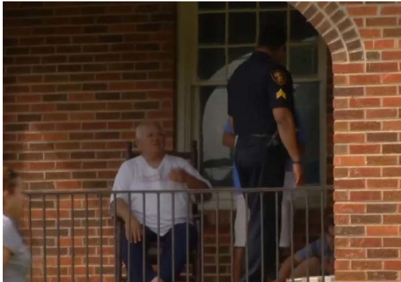
Algunos jefes policiales ya han externado su apoyo.