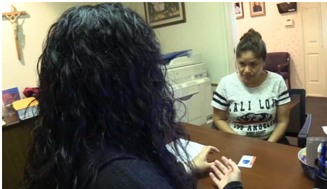
Las iglesias que son miembro del grupo Interfaith comenzarán a expedir estas credenciales en los próximos días.