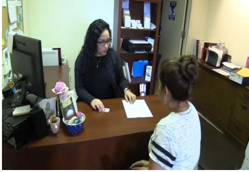
Las iglesias que son miembro del grupo Interfaith comenzarán a expedir estas credenciales en los próximos días.