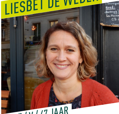
GENT / V / 47 JAAR