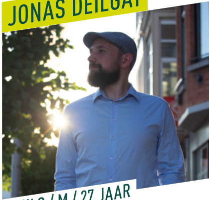
EEKLO / M / 27 JAAR

Ik geloof dat eenieder wie een fundamenteel conflict ervaart binnen onze partij het recht heeft om dat conflict aanhangig en bespreekbaar te maken met het oog op een oplossing. Daartoe hecht ik bijzondere waarde aan het belang van een eerlijke behandeling, heldere procedures en aan de goede werking van onze partij als geheel.