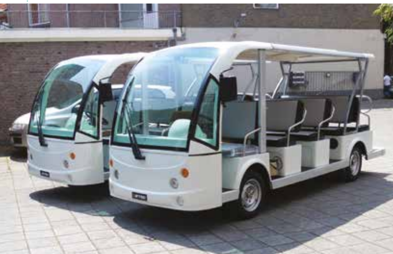
De Wandelbus zorgt ervoor dat iedereen kan genieten van het autovrij gebied.

Ook als u niet goed te been bent, kunt u genieten van het autovrij gebied. Er zijn voorbehouden parkeerplaatsen aan de ingang van het gebied. De gratis Wandelbus helpt u vervolgens verder in het autovrij gebied. Zo kunt ook u rustig winkelen of een terrasje doen.