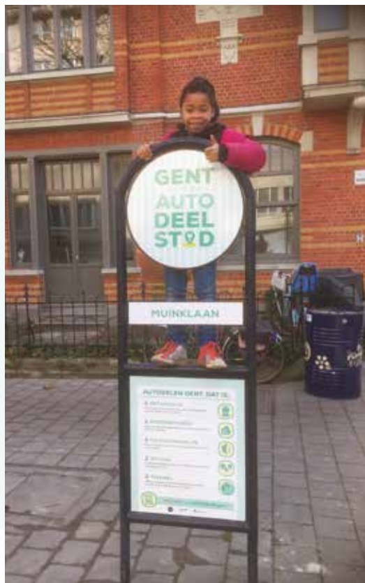
In de Muinklaan vind je de eerste autodeelhub van Gent

Meer informatie over autodelen: www.autodelen.gent .