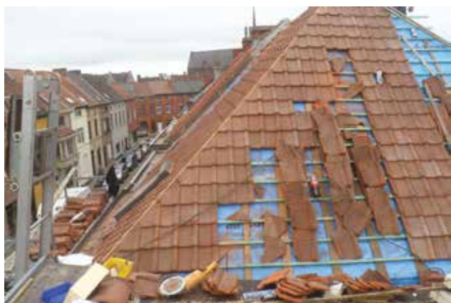
Noodkopers komen niet tot de noodzakelijke renovatiewerken. Het project Dampoort knapT OP biedt hen hierbij ondersteuning.

“Regelmatig zien we op het OCMW dossiers waarbij de noodkopers hun wooncomfort niet op eigen kracht kunnen verbeteren”, stelt raads-