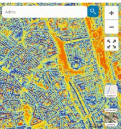
De zonnekaart geeft aan op welke daken in Gent het rendabel is om zonnepanelen te plaatsen.

De Energiecentrale geeft niet alleen antwoorden op allerlei kleine energievragen, maar verstrekt daarnaast zeer uitgebreid renovatieadvies, ook bij u thuis.