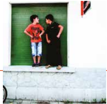
Dampoort Gent 2017 - Echo's uit de wijk