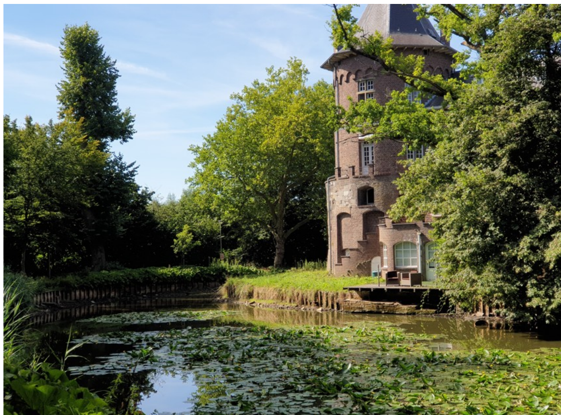
Het waterpeil van de vijver staat nu zo laag dat de visclub alle vissen die werden uitgezet weer uit de vijver vist en overbrengt naar een andere vijver.

"De verdroging van de aarde speelt ons parten in Kuringen", zegt schepen Joost Venken (Groen). "Sommigen dachten dat de pomp die de vijver van grondwater voorziet defect was, maar dat is dus niet zo. Zelfs op een diepte van meer dan 50 meter is er daar geen water beschikbaar om op te pompen. Ook uit de nabijgelegen Demer mogen we door het captatieverbod geen water overpompen. We volgen de situatie op de voet. Mocht het waterpeil nog zakken, dreigt vissterfte en daarom worden de vissen nu gevangen