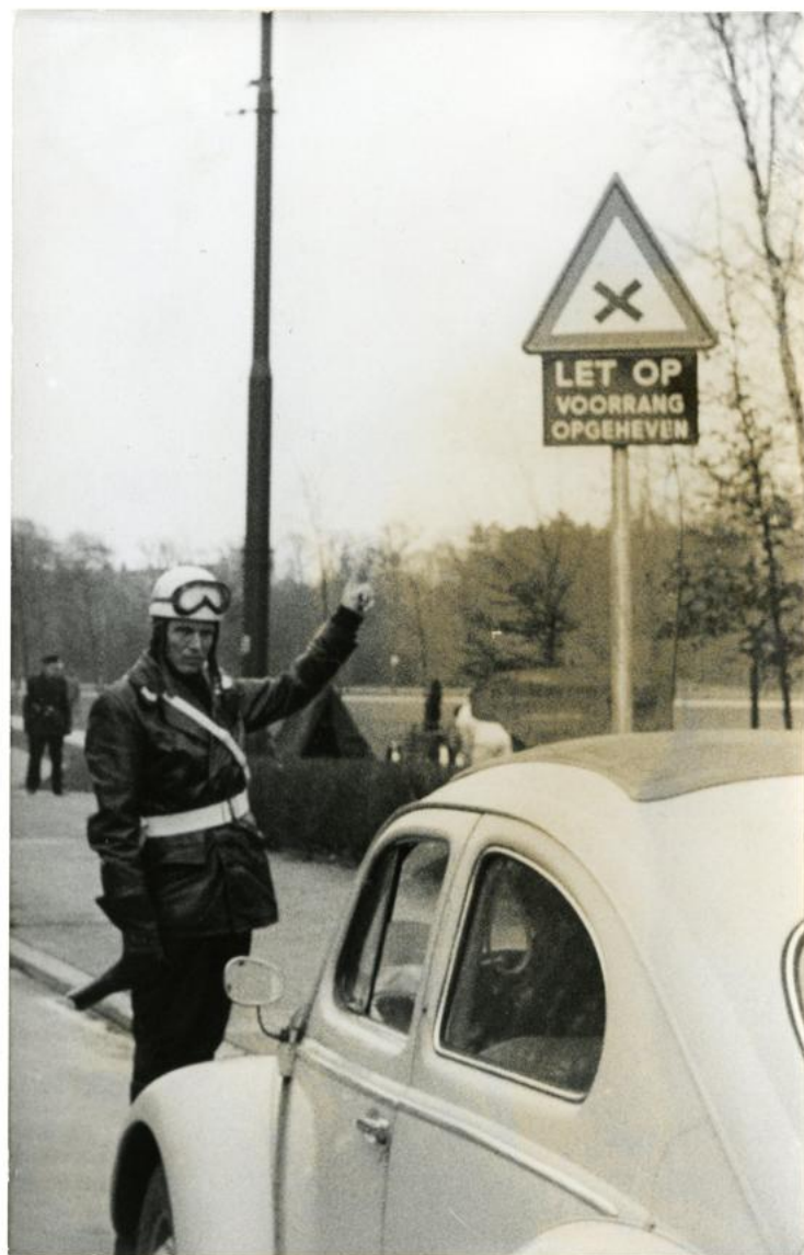
De voorrangregel is lang niet voor iedereen even duidelijk.

JEROEN SMEESTERS juicht de ontwikkeling dan weer toe. Volgens hem is de verkeersveiligheid meer gebaat bij een goede rijopleiding.