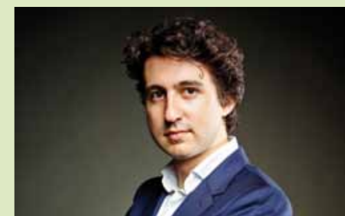
'Jesse Klaver, hoop van GroenLinks'