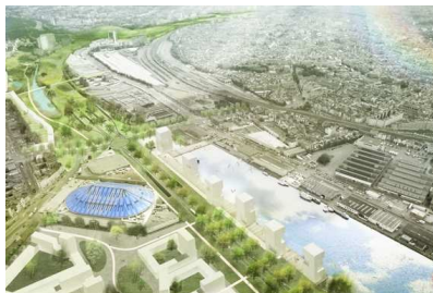
De overkapt Ring aan het Sportpaleis volgens Ringland.

De onderzoekers legden ten slotte ook de stelling voor dat het allemaal zo lang duurt omdat de Vlaamse regering te weinig naar de Antwerpenaar wil luisteren. Klopt, zegt 58,6 procent van de ondervraagden. Al zou je die laatste vraag ook richtinggevend kunnen noemen. Antwerpenaren hebben sowieso de neiging om dat te denken.