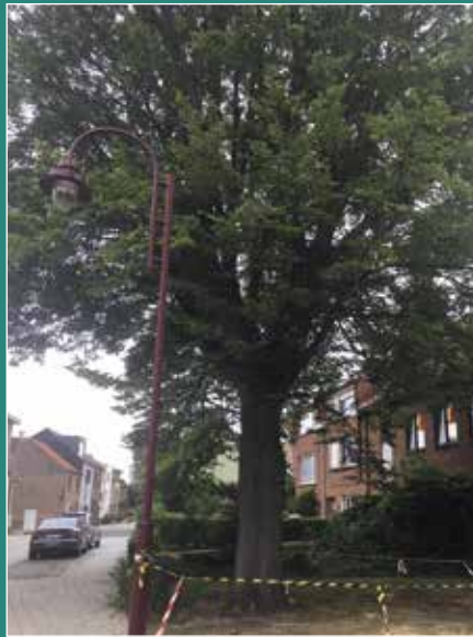
Het boombeschermingsplan moet bomen op bouwgronden beschermen. Zoals hier in de Lange Kroonstraat.

▷ Een grote bezorgdheid bij bouwen is de omgang met de bomen die er staan. De bomen waren er eerst dus we moeten ze met respect behandelen. Daarom heeft de gemeente een bomenbeschermingsplan opgesteld. Een lijst van tien maatregelen die de gemeente de bouwheer oplegt om bomen te beschermen.