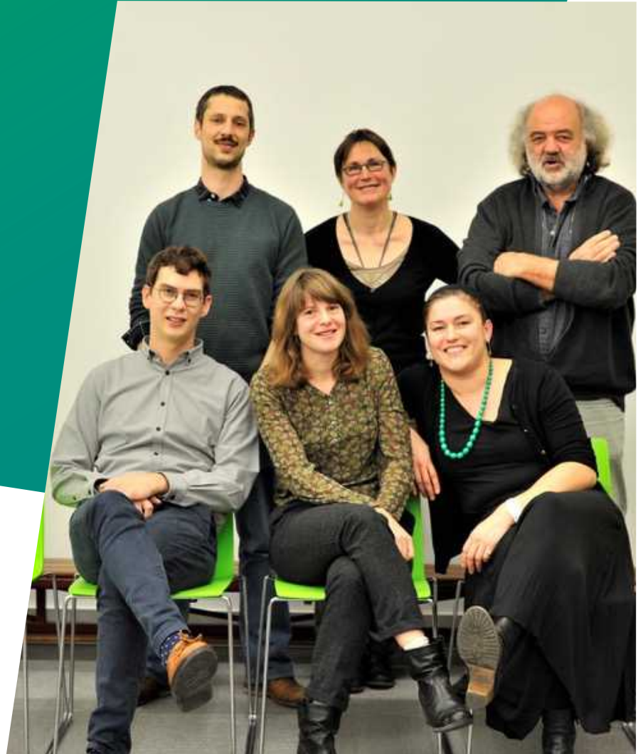
Groen zetelt in de gemeenteraad als tweede grootste partij, met maar liefst zes verkozenen