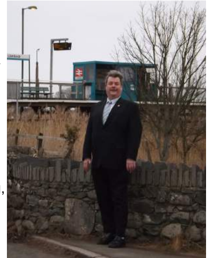
Llanbedr ar Lein Arfordir y Cambrian. Gorsaf Sinderela ar lein Sinderela.

Mewn etholiadau blaenorol, rwyf wedi ymgyrchu dros fuddsoddi yn ein seilwaith – yn y ffyrdd, y rheilffyrdd ac mewn Band Eang. Yn anffodus, ychydig a fuddsoddiwyd yn y ddau gyntaf, ac er bod arian wedi'i fuddsoddi mewn Band Eang, mae gweithio a dysgu o adref yn ystod y pandemig wedi amlygu bod y buddsoddiadau, i lawer gormod ohonom, yn dal i olygu bod gormod o gartrefi a gormod o fusnesau yn dal heb gysylltiadau rhyngwyd digonol. Yn fy ward gyngor i, ceir cartrefi lle mae'r gwifrau ffibr-optig yn pasio o fewn ugain troedfedd iddynt, ond nid oes cysylltiad ar gyfer y cartrefi hyn a does dim cynlluniau i wneud hynny; mae ein rheilffyrdd yn darfod ar waelod y rhestr fuddsoddi a'r oll sydd gennym yw rheilffyrdd sy'n addas ar gyfer y 1960au.