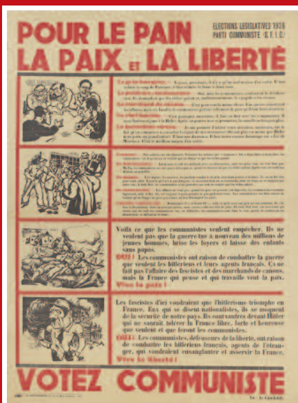
affiche du PCF pour les élections législatives de novembre 1946