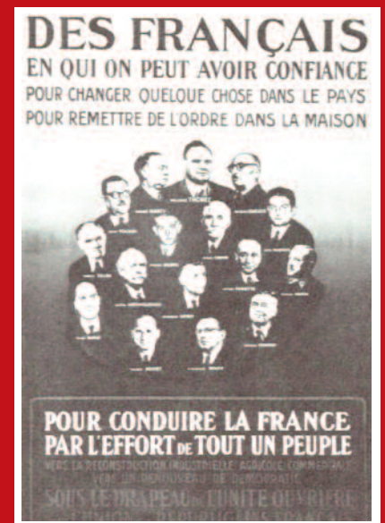
affiche du PCF pour les élections législatives de novembre 1946