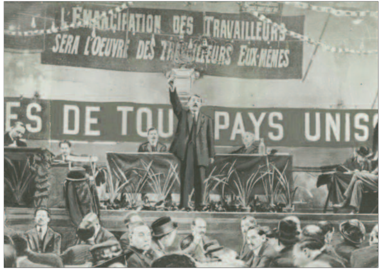
Marcel Cachin à la tribune du Congrès de Tours

Enfin on ne peut parler des 100 ans du PCF sans parler des 100 ans du Mouvement de la Jeunesse communiste de France : 2020 sera aussi le centenaire du MJCF et de la création de L'Avant-garde . Nos projets seront donc un élément pour que les vétérans se retrouvent avec les jeunes.