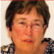
membre du CD/PCF du Finistère et de la commission nationale Santé/Protection sociale