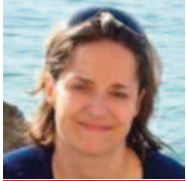
docteure en sciences des matériaux et nanosciences ingénieure