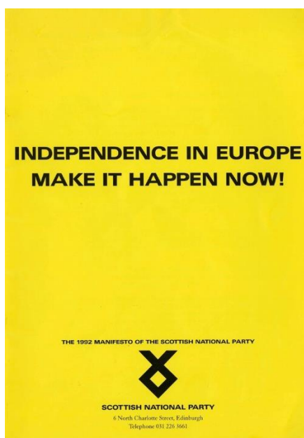
SNP Manifesto 1992

Ond roedd annibyniaeth wedi bod yn ganolog i ymgyrchoedd etholiadol yr SNP ers degawdau: