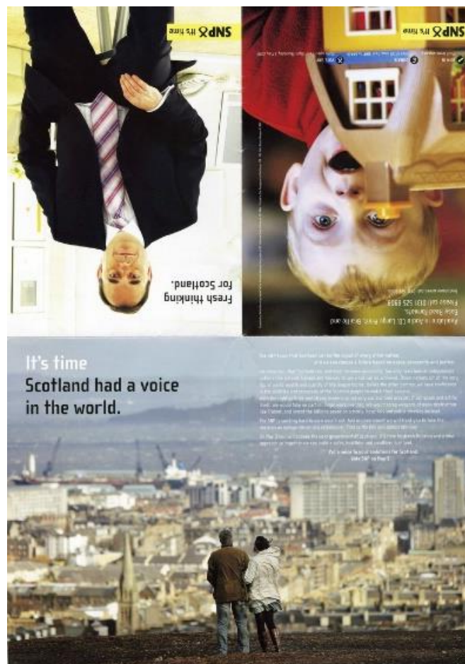
SNP Central Campaign Literature, 2007

Ni wnaethant droi i ffwrdd o'i hymrwymiad i annibyniaeth,