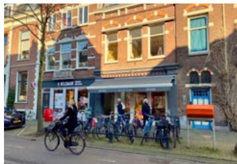
Des places vélos en priorité devant les magasins? Les Pays-Bas sont pionniers en la matière.

On le sait et on l'a déjà écrit. Supprimer des places autos devant les magasins est tout bénéfique pour les commerçants, quoiqu'en pensent ces derniers. De multiples études internationales le prouvent. Mais on sait aussi que les commerçants surestiment toujours la proportion de leurs clients automobilistes: à Bruxelles, les négociants estiment ainsi que plus de la moitié de leurs chalandiers viennent en voiture. En réalité, il ne s'agit que de 11%!