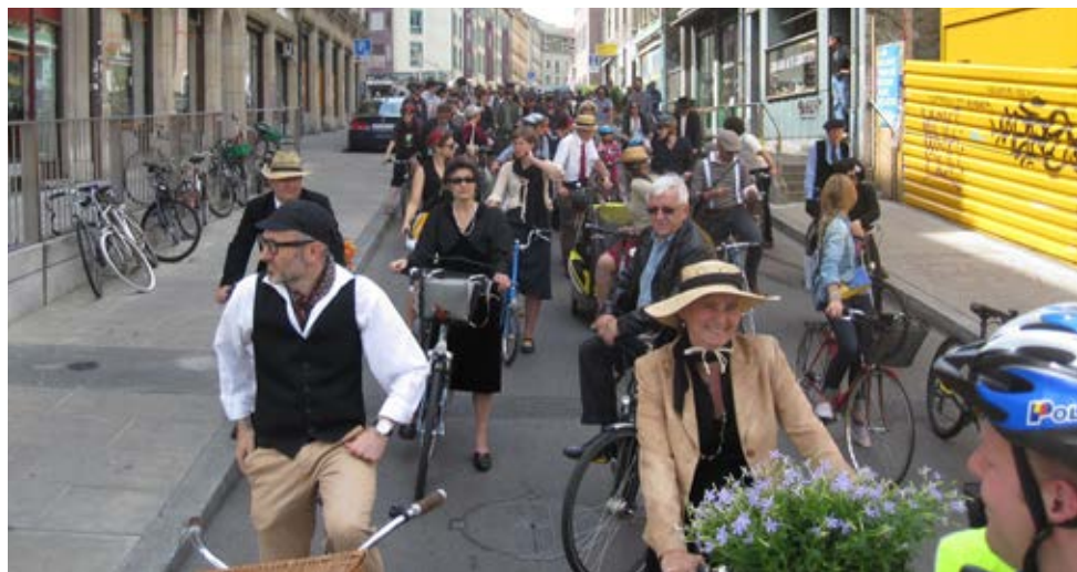
Une parade endimanchée au départ des Grottes (2011)

même d'avoir comparu. Je venais de prendre mes fonctions au sein de l'association et plongeais dans le même temps dans un débat qui n'arrêterait pas de flamber. Est-il ou non légitime que les cyclistes prennent parfois des libertés avec le code de la route, si celui-ci a été développé pour gérer des voitures dont la vitesse et les tonnes exigent un code strict? Après avoir emmené les journalistes dans le chahut urbain, de frayeurs en surprises malvenues, nous avions raconté l'expérience du cycliste genevois, engoncé dans le trafic et fragilisé au démarrage au feu. Les arguments étaient sécuritaires, mais aussi ceux de la fluidité du trajet pendulaire. Et chacun de vanter Amsterdam ou Copenhague, où l'on s'attèle à faire du vélo un choix efficace et confortable pour des trajets quotidiens jusqu'à 15 kilomètres. Inspirée par l'étranger, notre section genevoise avait porté une résolution à PRO VELO Suisse, lui demandant de s'engager pour