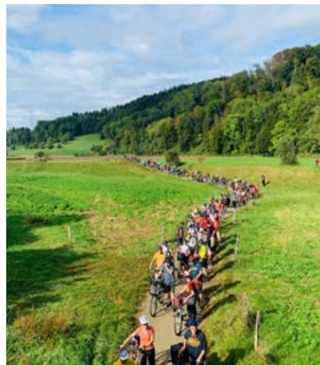
I Bike to move it, le cortège en route pour Berne.