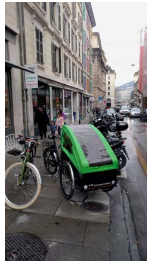
Pour donner plus de place aux vélos: votez pour celles et ceux qui les défendront sur le terrain!