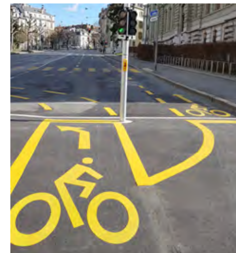
Nouveau aménagement sur le bvd des Philosophes

On notera les nouveautés suivantes: liaison Plainpalais-Champel (par Philosophes),