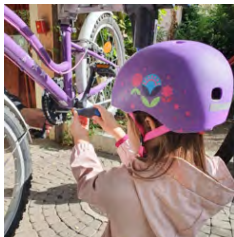
Pour apprendre à réparer son vélo il n'y a pas d'âge.

La Bicyclerie, fondée en mars 2020, propose, elle, un atelier vélo mobile qui se déplace sur demande auprès des collectivités et maisons de quartier. Son but est d'encourager la vélonomie (autonomie des cyclistes) à travers des ateliers vélos participatifs et des cours collectifs. L'atelier de la Bicyclerie n'offre pas de réparations contre rémunération, il faudra mettre les mains dans le cambouis si l'on veut régler son dérailleur! La mécanique vélo c'est aussi un prétexte pour se réunir autour d'un objet commun et partager ses anecdotes, bonnes combines et savoirs-faire.