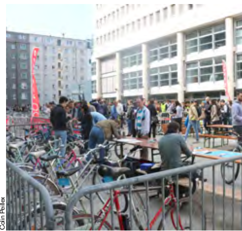
La Bicyclette Bleue lors de la Bourse aux vélos d'Uni Mail