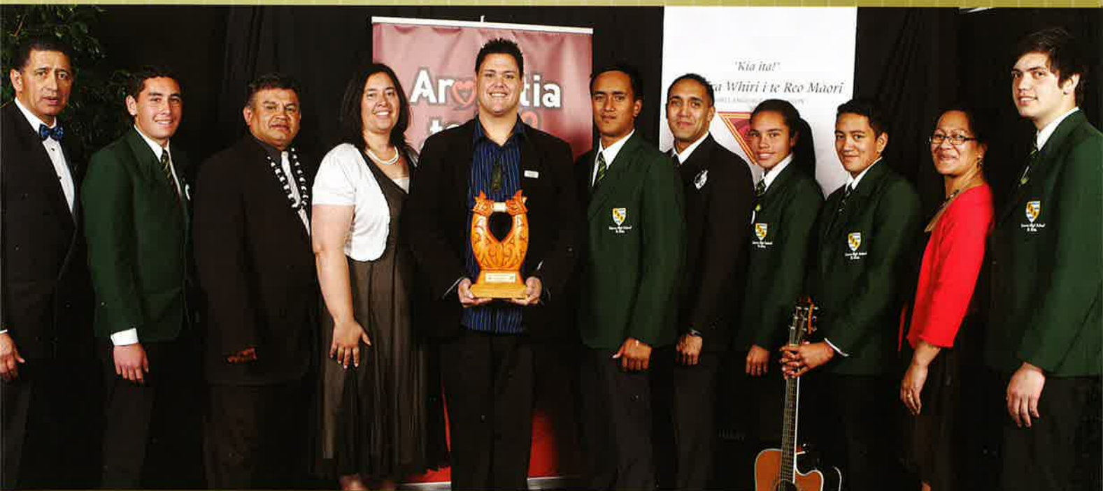
I whakawhiwhia te tohu o te Wiki o te Reo Māori ki Te Kura Tuarua o Tokoroa.

He mea whakatū ngā Tohu Reo Māori e Te Taura Whiri i te Reo Māori, e Te Puni Kōkiri me Te Kāhui Tika Tangata. I tautokona te hui nei e Te Tāhuhu o te Mātauranga, e Whakaata Māori, e Te Māngai Paho, e Vodafone, e Aotearoa Fisheries, e Te Manatū Taonga, e Te Matatini, e Te Kaunihera ā-Rohe o Te Moana-a-Toi, me Te Rōpū Hauora o Te Moana-a-Toi ki te Uru. Heoi anō, e kore e mutu ngā mihi a Te Taura Whiri i te Reo Māori ki ngā kaitono katoa rātou ko ngā tāngata whiwhi tohu i tēnei pō whakahirahira.