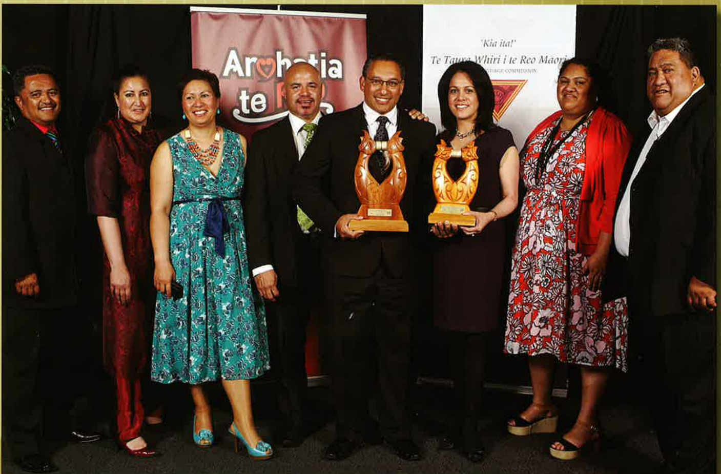
I whakawhiwhia te rōpū o Auckland Transport ki ngā tohu e rua.

I kaha mihia ngā mahi a Auckland Transport i taua wiki i runga i ngā pāpaho hangarau pērā i te Facebook me Twitter. E ai ki a Glenis Philip-Barbara, “Hei tauira ngā mahi a Auckland Transport o ngā tūmomo mahi e wawatatia ana huri noa i te motu.”