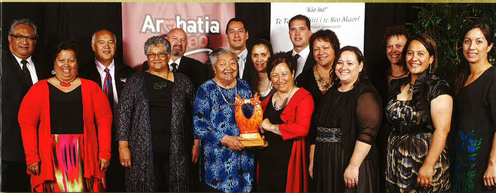
Ko Te Whare Takiura o Waiariki ngā toa o te wāhanga o Ngā Kura Tuatoru.

I tū te pō whakanui i Ngā Tohu Reo Māori ki te TECT Arena i Tauranga i te 16 o Whiringa-ā-rangi. Ko te tuaiwa tēnei o ngā hui whakanui i ngā mahi a ngā rōpū maha huri noa i te motu ki te whakatairanga i tō tātou reo. He mea whakahaere ngā tohu tuatahi i Te Whanganui-a-Tara. Mai i tērā rā ki ināianei, kua whanake haere te kaupapa, waihoki, ngā mahi a ngā kaitono ki te whakanui i tō tātou reo.