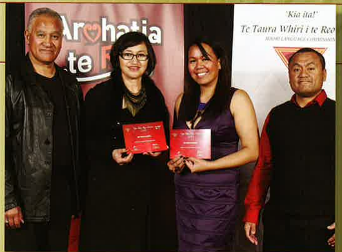
Te rōpū o Vodafone NZ rātou ko Hika Group Ltd.