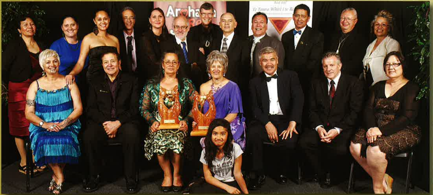
Ngā Tamatoa me Te Rōpū Reo Māori, ngā toa o te wāhanga Te Tira Aumangea i Ngā Tohu Reo Māori 2012.

Ko Te Tira Aumangea te ingoa o te tohu ka tukua ki tētahi iwi, ki tētahi rōpū rānei e mahi ana i te hāpori, hei whakanui i ā rātou mahi whakahirahira ki te whakapakari, ki te whakarewa ake i te reo Māori. Ko te hunga i toa i tērā tau ko Te Rōpū Kaitiaki o Te Reo o Taranaki, i tēnei tau, i whakawhiwhia te tohu nei ki Ngā Tamatoa me Te Rōpū Reo Māori.