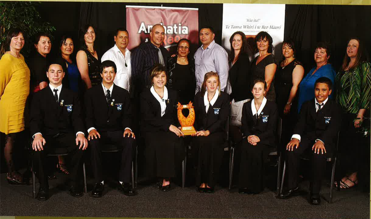
Ko ngā ākonga o Te Kura Tuarua o Kerikeri, rātou kō ō rātou kaitautoko i te pō tuku taonga 2012.

He mate nui te ngaronga o te reo Māori ki ngā rangatahi o Te Kura Tuarua o Kerikeri, nā whai anō i te whakatūnga o te Whakataetae Whakaoti Rapanga ā-Motu (National Community Problem Solving Championships) he māmā noa iho ki a rātou te kimi mai i tētahi take hei whai mā rātou.