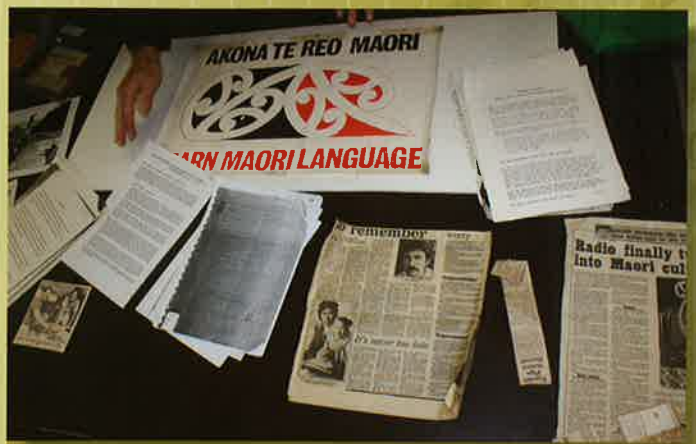
He kohinga kōrero mai i te wā o te pitihana mō te reo Māori.

te whakanui i tēnei āhuatanga. Koia nā tonu te āhua, he wā roa te whā tekau tau. Ko ētahi kua ngaro atu i mua tonu i tō rātou kaumātutanga, ko ētahi anō kei ngā tōpito katoa o te whenua (otirā, o te ao) e kaumātua haere ana. Ko te mea nui i whakamaharatia ngā mahi i tutuki i a rātou i taua rā, i tērā whā tekau tau. Ki te kore ērā kaumātua, kua kore pea te nuinga o ngā kaupapa reo Māori e rere haere ana i te wā nei.