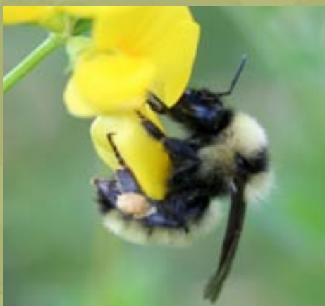
David Cappaert, ipmimages.org

• NCAT/ATTRA. Fundamentos de la Agricultura Sostenible. www.attra.ncat.org/espanol/fundamentos.html